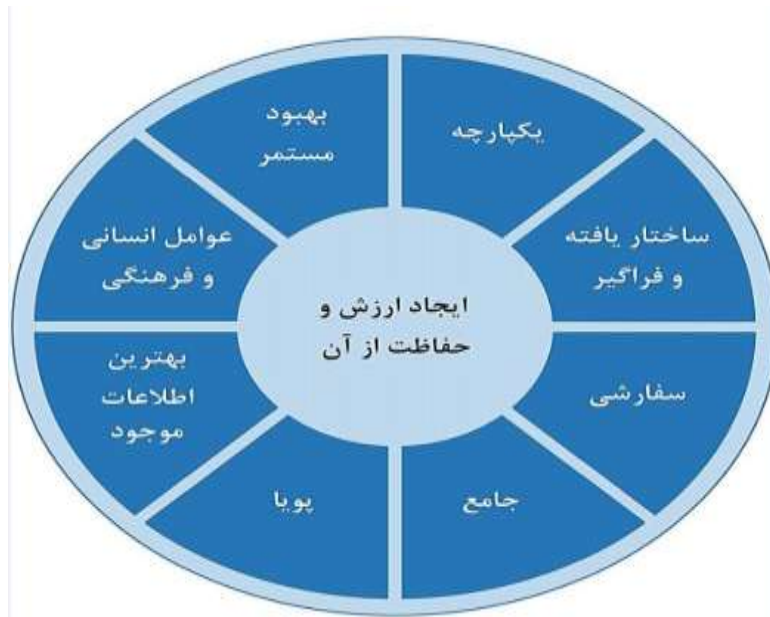
شکل ۲- اصول

مدیریت ریسک کارآمد، به عناصری که در شکل ۲ نشان داده شده نیاز دارد. این عناصر را می‌توان به صورت زیر، بیشتر توضیح داد: