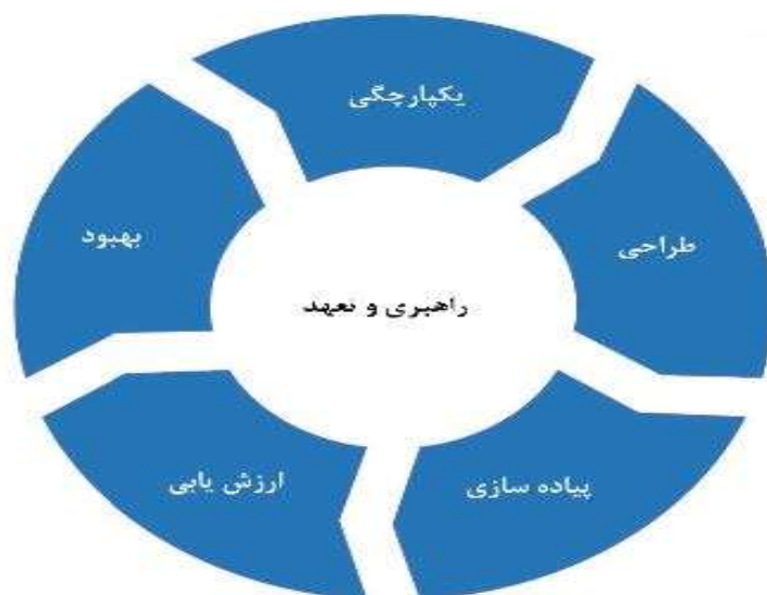
شکل ۳- چارچوب

مقصود از چارچوب مدیریت ریسک، کمک به سازمان برای یکپارچه‌سازی مدیریت ریسک در فعالیت‌ها و کارکردهای مهم است. اثربخشی مدیریت ریسک، به یکپارچگی آن در حکمرانی سازمان، شامل تصمیم‌سازی، بستگی دارد. تحقق این امر، به پشتیبانی ذی‌نفعان، به خصوص مدیریت ارشد سازمان نیاز دارد. توسعه چارچوب، شامل یکپارچه‌سازی، طراحی، پیاده‌سازی، ارزش‌یابی و بهبود مدیریت ریسک در سرتاسر سازمان است. شکل ۳، اجزای یک چارچوب را نشان می‌دهد.